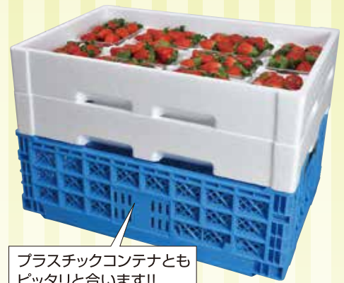
プラスチックコンテナともピッタリと合います!!